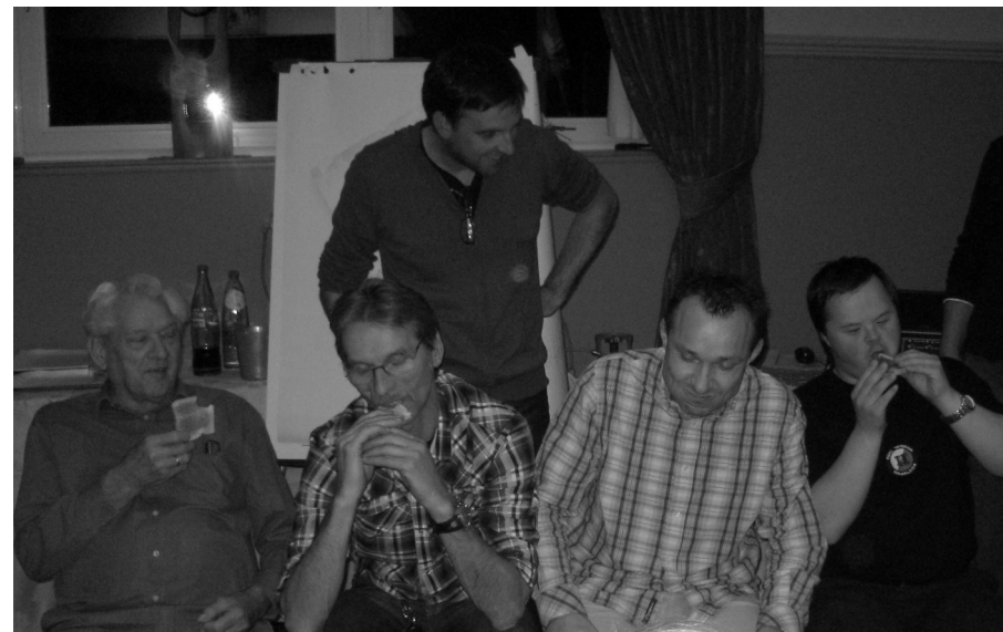
Sfeerfoto van het weekend van Den Twee in Edingen.